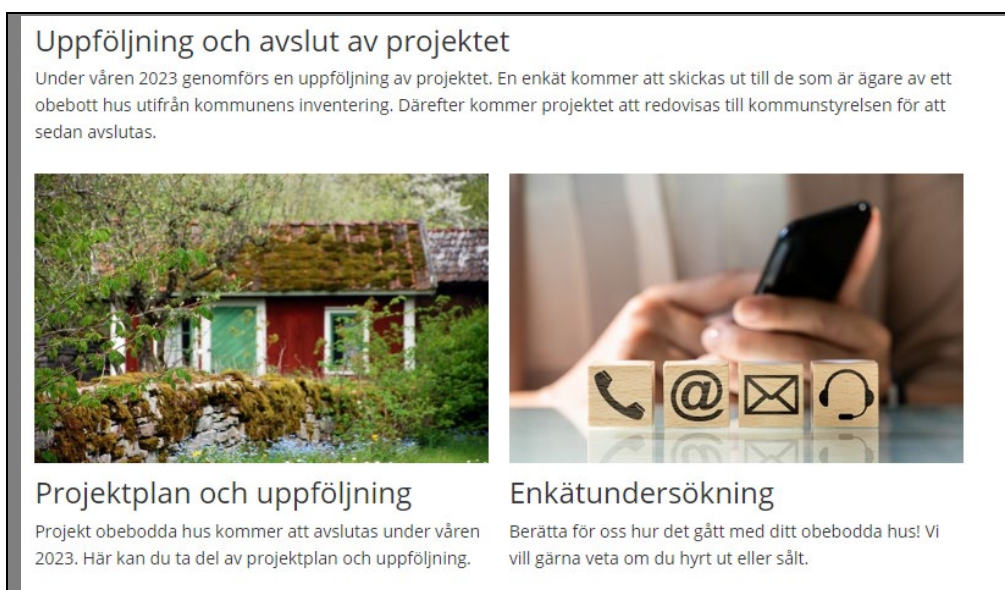
Figur 8 Bild med utklipp från kommunens webbplats

Information om att projektet avslutas publiceras på kommunens webbplats, www.odeshog.se/obeboddahus där också projektplan och slutrapport publiceras.