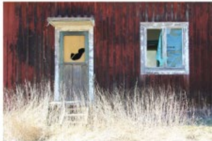
Några ödehus i Ödeshög som inventeras av projektledaren David Svensson. Någonstans mellan 100 och 200 tänkbara ödehus tror kommunen att man har i Ödeshög.