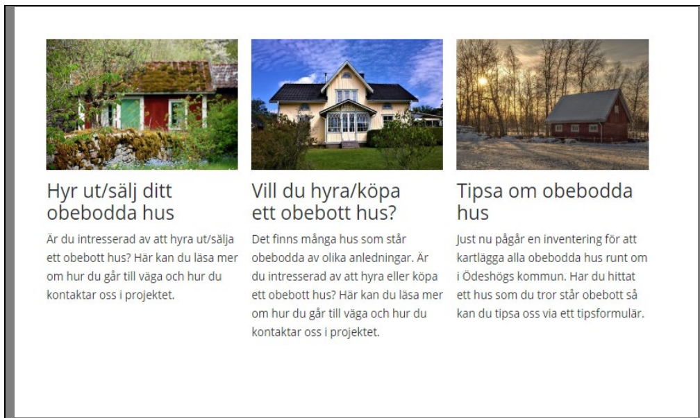
Figur 2 Bild med utklipp från kommunens webbplats

Rapporteringsmöjligheten integrerades med kommunens kommunkarta så att besökarna kunde rapportera in obebodda hus på ett enkelt sätt. Det fanns även möjlighet för intresserade av obebodda hus i kommunen att lämna sina kontaktuppgifter på sidan, likaså kunde ägare till obebodda hus lämna sina kontaktuppgifter.