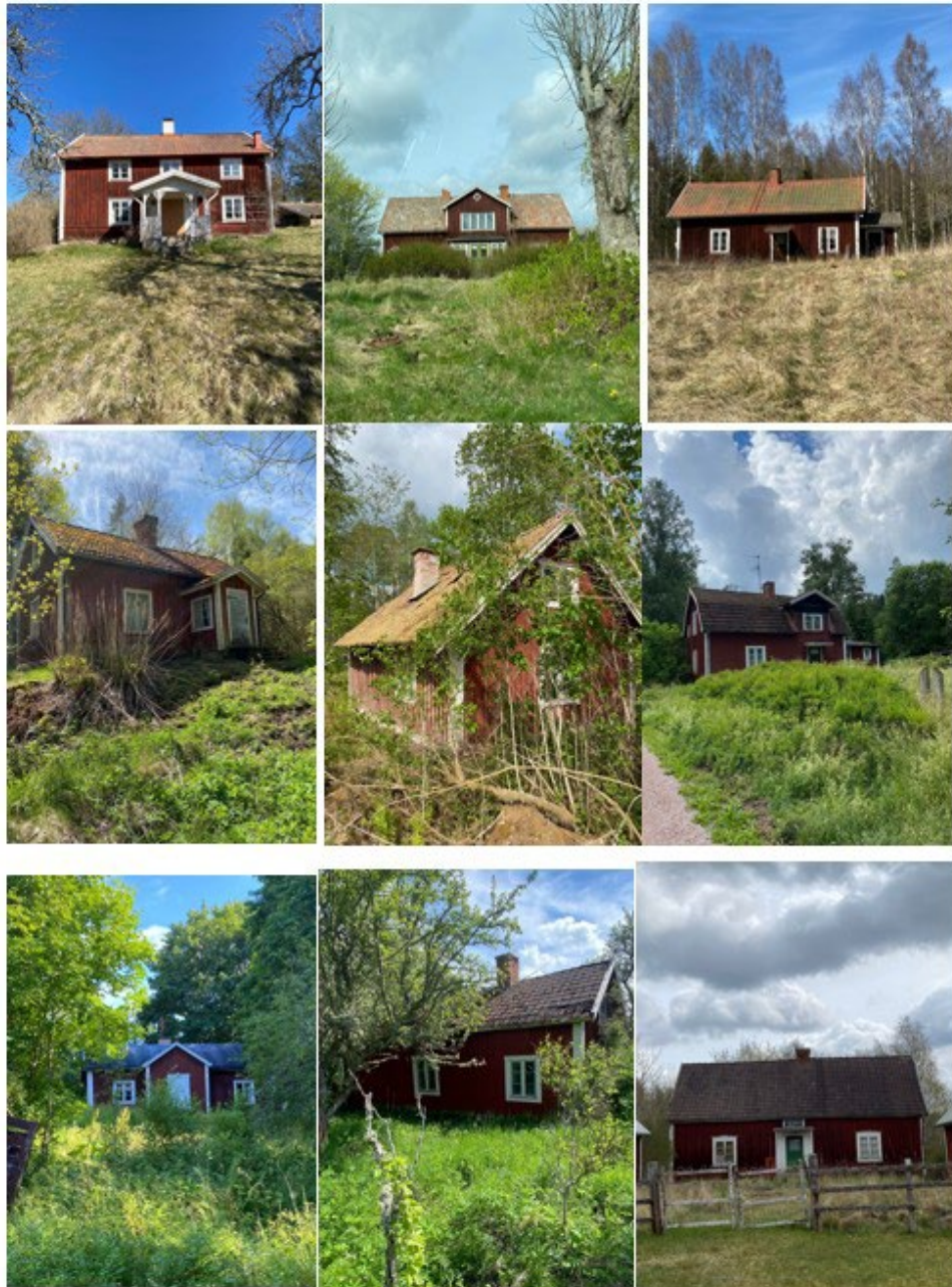
Figur 7 Bildkollage på obebodda hus